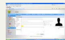
Imagen de uno de los apartados de 'Geriges' en el que se incluyen los datos personales de cada usuario. 214 KB 768 x 480 pixels Descargar